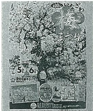
日は、史跡尾張国分寺跡を見学するウオーキングツアーもある（雨天中止）。 梅まつりのチラシ 梅天中。