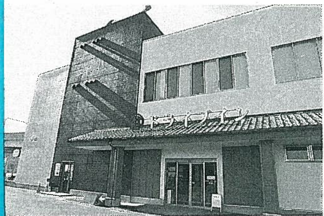
お土産品を販売するドライプリンりんくう常滑店

ムのようなフルーツに変化させているのが特徴。甘みを抑えた柔らかいプリンの中に丸ごと1個入れ、プリン表面には酸味をきかせたゼリーをコーティングした。お土産用に持ち帰りを意識し、プリンが崩れにくくするためという。