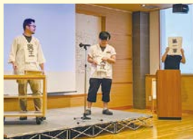
エリア発表(名古屋エリア)

第46期の表彰者発表です！各賞、審査員の協議により選ばれました。今回は表彰式が行えなかったため、まるは新聞での発表となりました。各部門で受賞の方、永年勤続の方、おめでとうございます。また、指針発表会後半に「まるはらしく感動を与える発表を」という題目でエリア対抗の発表を実施。 まるはグループを3つのエリアに分け、各エリアから劇、歌、踊り、試食などなど大笑いあり涙ありのパラエティに富んだ、とてもまるはらしい発表でした。この様子を動画配信し、取引企業様にも審査員として1票を投票していただき、FAXにてご返送いただきました。どのエリアも個性的で甲乙つけがたかったのですが…結果はこのようになりました。