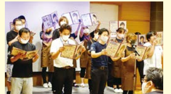
エリア発表(南知多エリア)

役員と取引企業様の投票により順位を決定 ▶1位 南知多エリア ▶2位 名古屋エリア ▶3位 常滑エリア