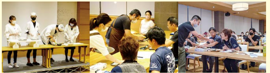
エリア発表(常滑エリア)