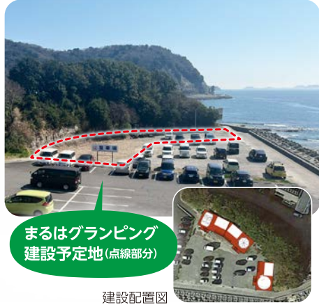
まるはグランピング建設予定地(点線部分)