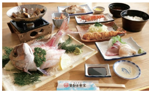
春の南知多コース/3,800円(税別)