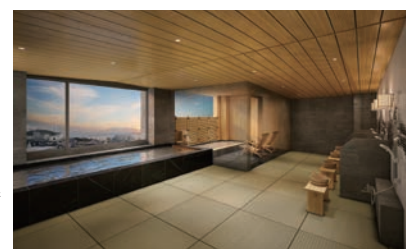
4F天然温泉の大浴場(イメージ)

「新名称の決定」 まるは食堂旅館「別邸」の新名称が決定しました。これまでいくつかの候補が挙がってきましては検討を繰り返してきましたが、意見がまとまり決定しました。その名も「はずのほし」。名称にある「はず」は、宿が知多半島の先端に位置し、周りが「羽豆岬」「羽豆神社」などの観光スポットとして有名なことから。三河湾や伊勢湾、日間賀島や篠島、神島などが見える絶景ポイントでもあり、そこから見える海も水平線が見えるくらい開放的で、特に夕日が綺麗に見えるところ。『ほし』には、この「旅館」への2つの想いが込められているようです。知多半島の先端で海に囲まれる漁港近くにある