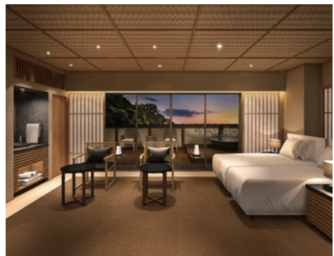
6F客室(特別室/イメージ)

「新名称の決定」 まるは食堂旅館「別邸」の新名称が決定しました。これまでいくつかの候補が挙がってきましては検討を繰り返してきましたが、意見がまとまり決定しました。その名も「はずのほし」。名称にある「はず」は、宿が知多半島の先端に位置し、周りが「羽豆岬」「羽豆神社」などの観光スポットとして有名なことから。三河湾や伊勢湾、日間賀島や篠島、神島などが見える絶景ポイントでもあり、そこから見える海も水平線が見えるくらい開放的で、特に夕日が綺麗に見えるところ。『ほし』には、この「旅館」への2つの想いが込められているようです。知多半島の先端で海に囲まれる漁港近くにある