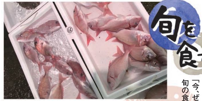
毎日、旬な新鮮な食材を仕入れています!